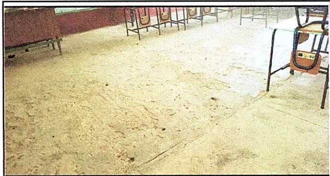
Foto1: PISO DE LAS 3 AULAS EN MAL ESTADO